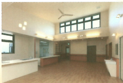
居間・食堂：仲間とゆったり 食事や談話を楽しめる空間