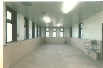
浴室：心身の状況に応じた 入浴設備を完備