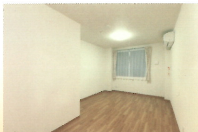
居室：広々としたプライベート スペース